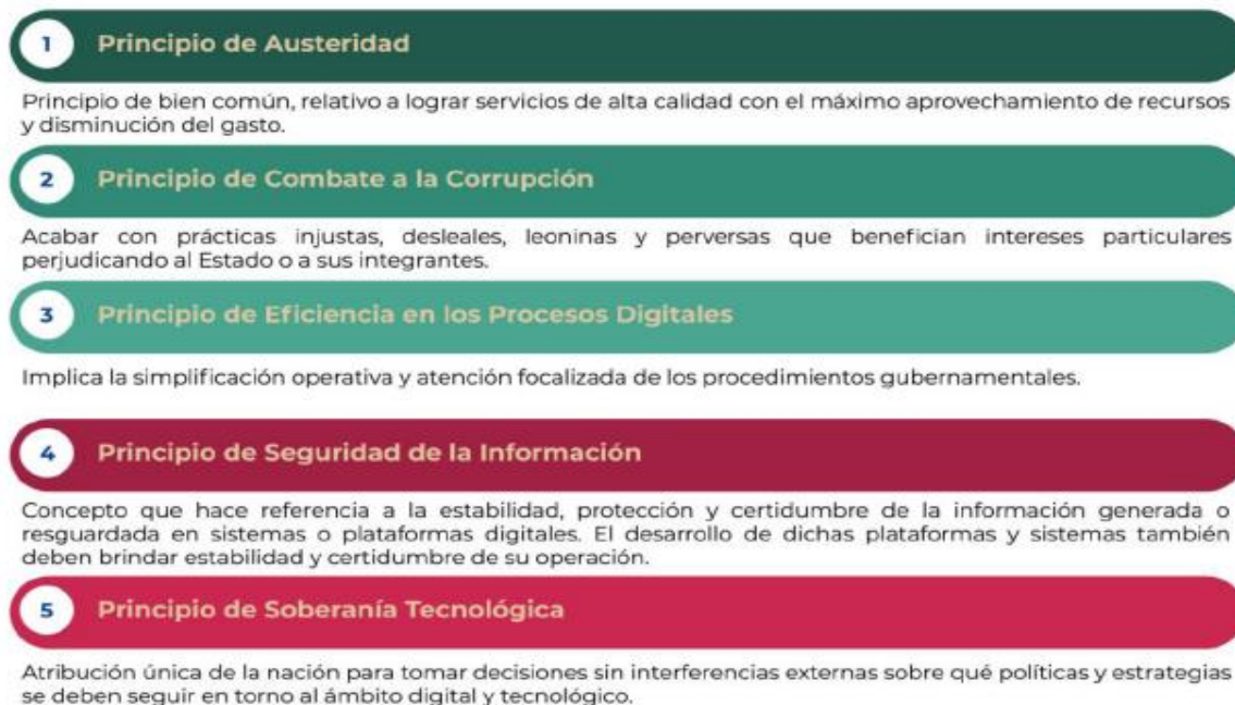
Figura 1. Principios de la EDN

La EDN aterriza las capacidades gubernamentales en la prioridad de atender los planteamientos de una adecuada gobernanza tecnológica, la mejora de los servicios digitales y la optimización de los procesos, enmarcando dichos propósitos en los siguientes principios: