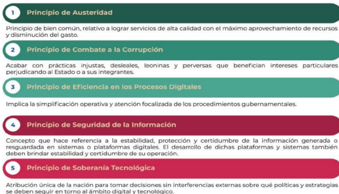
Figura 1. Principios de la EDN

La EDN aterriza las capacidades gubernamentales en la prioridad de atender los planteamientos de una adecuada gobernanza tecnológica, la mejora de los servicios digitales y la optimización de los procesos, enmarcando dichos propósitos en los siguientes principios: