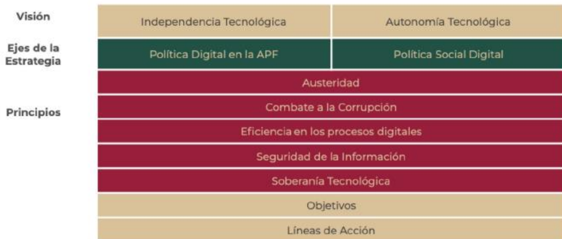
Figura 3. Marco estructural de la EDN

La siguiente figura esquematiza dicho marco estructural: