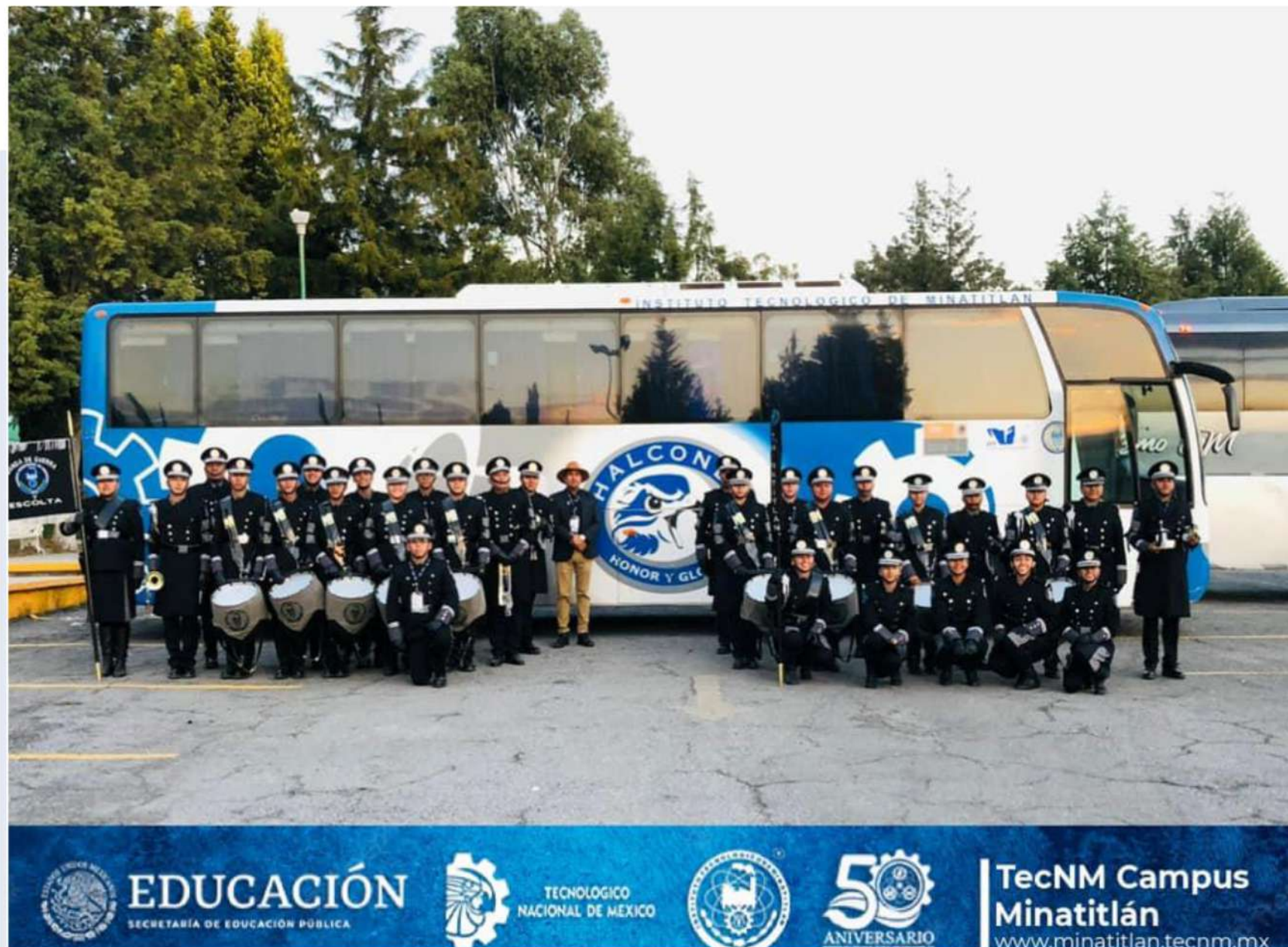
BANDA DE GUERRA Y ESCOLTA

TecNM Campus Minatitlán minatitlan.tecnm.mx