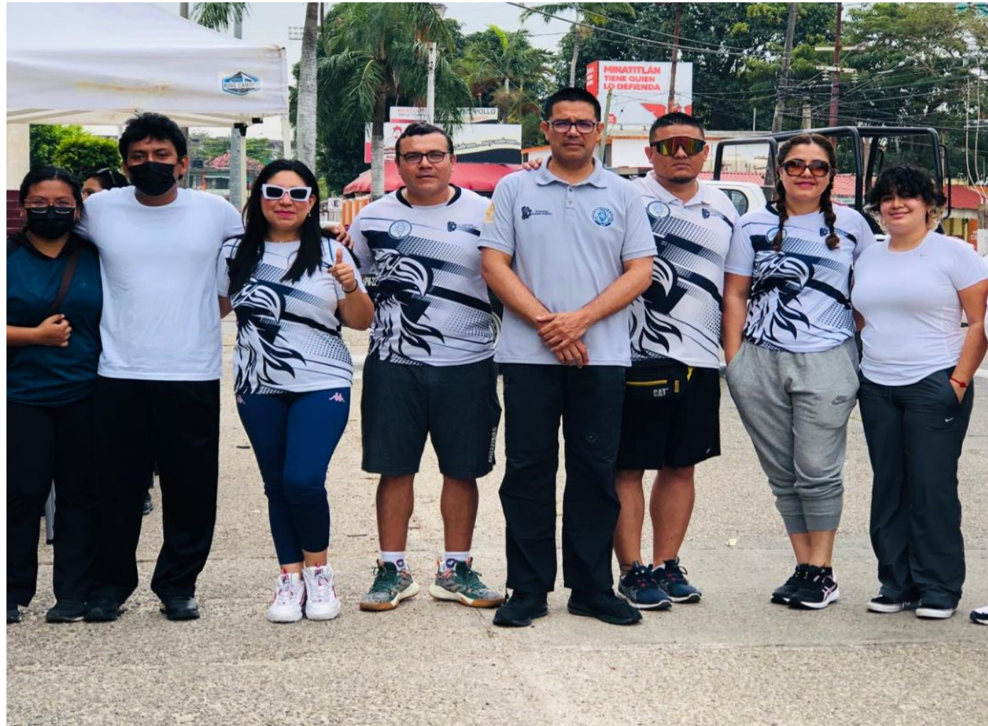
Actividad en Coordinación con el H. Ayuntamiento de Minatitlán