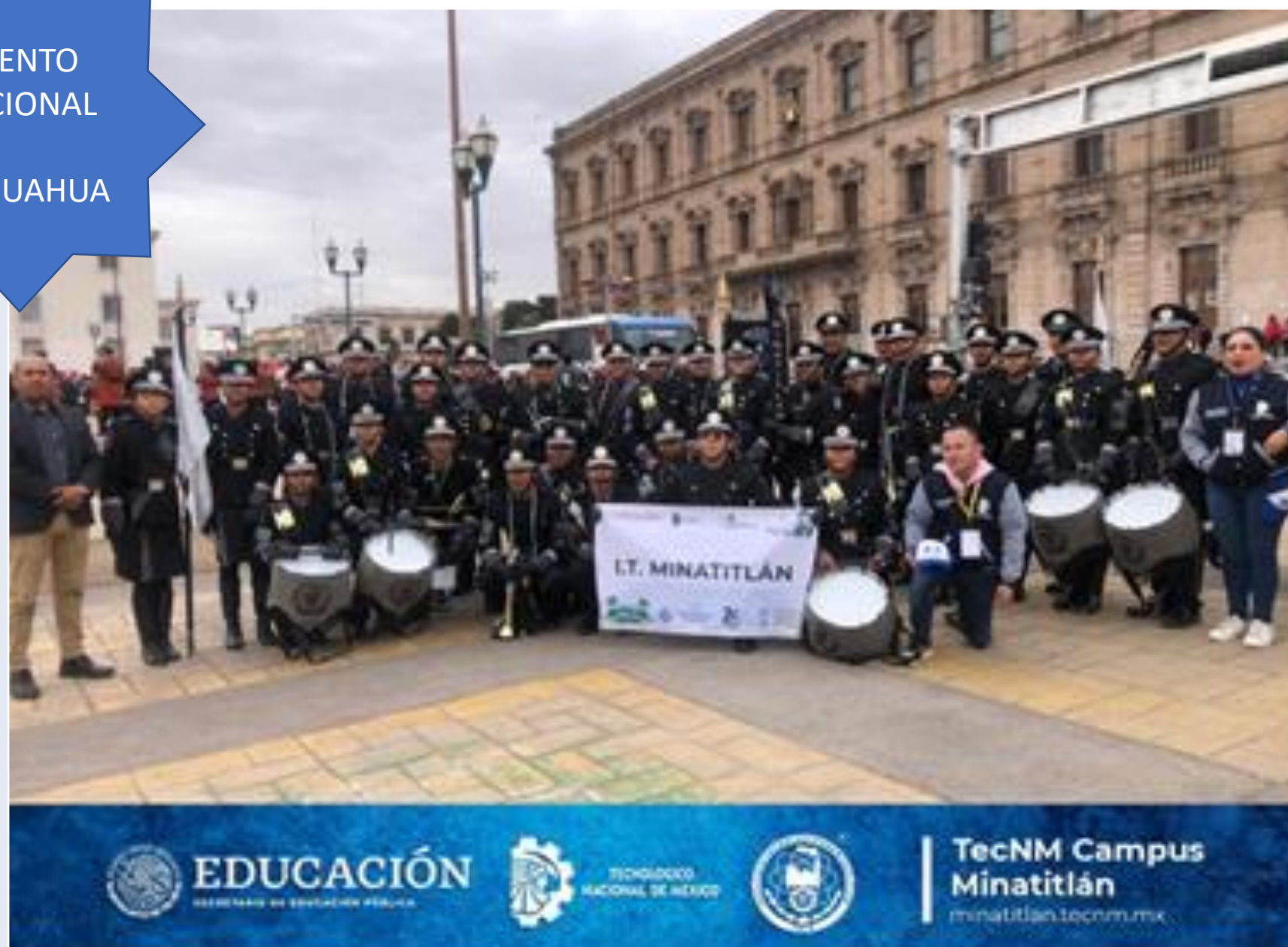
BANDA DE GUERRA Y ESCOLTA