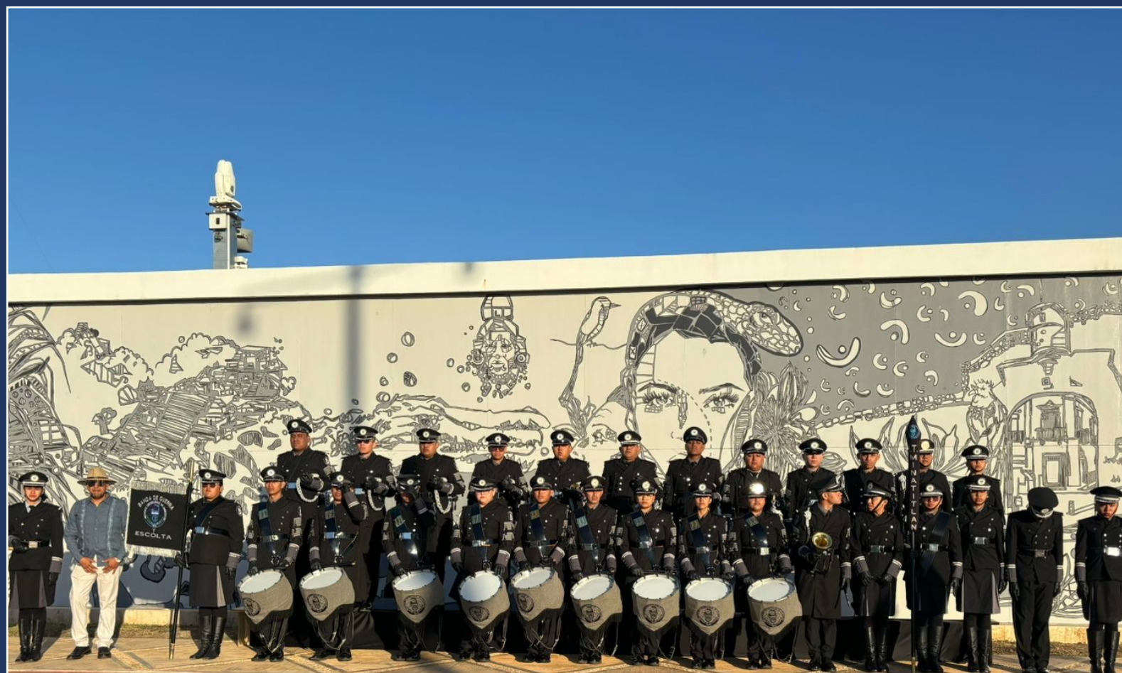
BANDA DE GUERRA Y ESCOLTA